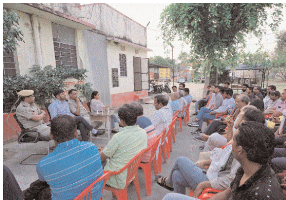
दौरान शांति समिति सदस्यों को कहा वर्तमान परिस्थितियों में मोबाइल फोन अपराध को बढ़ावा दे रहे हैं। बालिंग व नाबालिंग