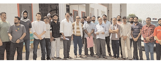
पड़ता है। इस विषय पर संज्ञान लेते हुए इस मार्ग को खुलवाया जाए। यह मार्ग सीवरेज लाइन वालों के कारण बंद है। सीवरेज चैंबर इतने ऊंचे बने हैं कि उस मार्ग का पानी सीवरेज चैंबर में नहीं जा पाता है। ना ही कब्रिस्तान की तरफ जाने

डीडवाना (हुक्मनामा समाचार)। जिला कलेक्टर को पठान समाज के लोगों के द्वारा एक जापन सोपा गया है। यह जापन कब्रिस्तान पठानान एवं मोचियान जाने हेतु रास्ता खुलवाने की मांग को लेकर सोपा गया है। जापन में मांग करते हुए बताया है सिंगी तलाई के पीछे की और कब्रिस्तान पठानान एवं मोचियान स्थित है। जिसमें इस मार्ग पर जाने वाले रास्ते सभी जलमगन हो गए हैं। जिसकी वजह से काफी परेशानियों का सामना करना