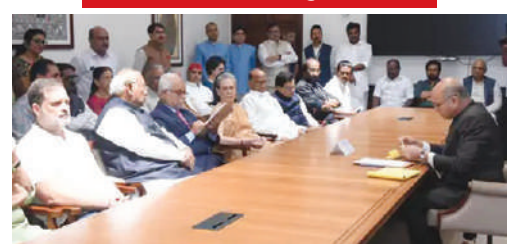
खड़गे और सोनिया-राहुल समेत कई नेता मौजूद रहे