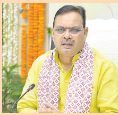
जयपुर (हुक्मनामा समाचार)। मुख्यमंत्री भजनलाल शर्मा प्रदेश के युवाओं की प्रतिभा को अंतर्राष्ट्रीय मंच उपलब्ध कराने