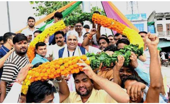
युवाओं को शिक्षा व खेल में बेहतर अवसर उपलब्ध कराने के लिए प्रतिबद्ध

उन्होंने कहा कि लक्ष्मणगढ़ व गांव के बच्चों को अच्छी व आधुनिक शिक्षा मिल सके इसके लिए जिले में ई-लाइब्रेरी बनवाई जा रही है। उन्होंने कहा कि सभी सरकारी स्कूलों में इस दिशा में काम चल रहा है। उन्होंने कहा कि बच्चों की साइंस व मेथ के प्रति अभिरुचि बढ़े इसके लिए केन्द्र सरकार अटल टिकरिंग लैब बनवा रही है। उन्होंने कस्बेवासियों से कहा कि फूल माला व साफे के स्थान पर लाइब्रेरी के लिए पुस्तकें भेंट की जाए जिससे युवा पीढ़ी नये विषयों को जान व समझ सकें। उन्होंने कहा कि जिले के युवाओं को खेल व मैदान से जोड़ने व उन्हें आगे बढ़ने के अवसर देने के उद्देश्य से अलवर सांसद खेल उत्सव प्रारम्भ किया गया है जो हर वर्ष आयोजित होगा। उन्होंने कहा कि प्रधानमंत्री नरेन्द्र मोदी के कुशल नेतृत्व में पिछले दस सालों में देश का चहुंमुखी विकास हो रहा है और कृषि के क्षेत्र में देश आत्मनिर्भर बन गया है। इसमें केन्द्रीय सरकार की योजना का महत्वपूर्ण योगदान रहा है।