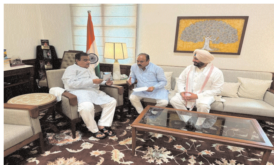
सवाई माधोपुर - खण्डार के लोगो का मध्यप्रदेश से सम्पर्क बिल्कुल टूट गया है। उक्त पुलिया

बिल्कुल टूट गया है एवं जिसके कारण यातायात अवरूद्ध हो गया। वर्तमान में पुलिया टूटने के कारण रास्ता बिल्कुल बंद है व आवागमन बाधित है। इसके साथ ही आवागमन बंद होने के कारण मूलभूत सुविधाओं से विधानसभा खण्डार और श्योपुर (मध्यप्रदेश) की आम जनता लाभ से वंचित है। व्यापार से समबन्धित कार्य, चिकित्सा सेवा से समबन्धित, शिक्षा व्यवस्था, डीजल सप्लाई व यात्रियों के आवागमन से लेकर अन्य समबन्धित अतिआवश्यक सेवाओं को लेकर वर्तमान में क्षेत्र के लोग काफी असुविधा का सामना कर रहे हैं। पुलिया के अभाव में सभी अतिआवश्यक कार्य रुक गये हैं। इसके साथ ही