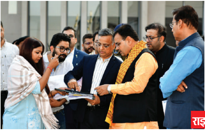
राइजिंग राजस्थान ग्लोबल इन्वेस्टमेंट समिट