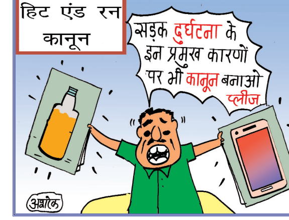
हिट एंड रन कानून

सड़क दुर्घटना के इन प्रमुख कारणों पर भी कानून बनाओ कोरोना संक्रमण खत्म होने के बाद इसको लागू किया जाएगा। अगस्त 2022 में अमित शाह ने कहा था कि नागरिकता संशोधन अधिनियम कोविड वैकसीनेशन अभियान पूरा होने के बाद लागू करने की प्रक्रिया शुरू होगी। इसी बीच यह मामला सुप्रीम कोर्ट में भी पहुँच गया। कई लोगों ने नागरिकता संशोधन अधिनियम को धर्म के आधार पर नागरिकता देने वाला बताते हुए चुनौती दी। तमिलनाडु की सत्तारूढ़ डीएमके ने 2022 में सुप्रीम कोर्ट में एक शपथपत्र दायित्व करके नागरिकता संशोधन अधिनियम को देश की धर्मनिरपेक्षता के ताने-बाने के खिलाफ बताया। उसने कहा कि नागरिकता संशोधन अधिनियम धर्म के आधार पर भेदभाव करता है। यह तमिल लोगों के खिलाफ है। तमिलनाडु और डीएमके पहला ऐसा राज्य और पार्टी है जो नागरिकता संशोधन अधिनियम के खिलाफ कोर्ट पहुँची। अब खबर आई है कि लोकसभा चुनाव से पहले इसको अधिसूचित किया जाएगा। एक वरिष्ठ सरकारी अधिकारी ने मंगलवार को एक समाचार एजेंसी को बताया कि नागरिकता संशोधन अधिनियम (नागरिकता संशोधन अधिनियम) के कारण देश में बड़े पैमाने पर विरोध प्रदर्शन शुरू होने के चार साल बाद, सरकार नागरिकता संशोधन अधिनियम नियमों के साथ तैयार है और लोकसभा चुनाव 2024 से काफी नुकसान उठने लगा करेगी। पदाधिकारी ने कहा, नियम तैयार हैं और ऑनलाइन पोर्टल भी मौजूद है और पूरी प्रक्रिया ऑनलाइन होगी। आवेदकों को उस वर्ष की घोषणा भारत में प्रवेश किया था। आवेदकों से कोई दस्तावेज नहीं मांगा जाएगा। जो लोग पहले ही नागरिकता के लिए आवेदन कर चुके हैं उन्हें नए सिरे से आवेदन करने की आवश्यकता नहीं होगी। इस लेख में विचार लेखक के है समाचार पत्र का इससे कोई सरोकार नहीं -सम्पादक