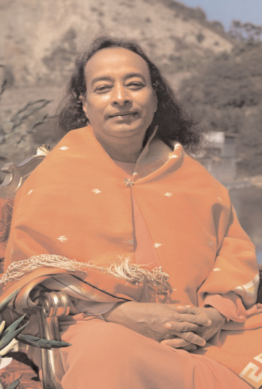
श्री श्री परमहंस योगानन्द

गृह अध्ययन की सामग्री भी उपलब्ध है, यह जानकर तो मन बलियों उछलने लगा। योगी कथामृत में वर्णित,अपने गुरु की तलाश में अनेक संतों से योगानन्दजी की भेंट और अंततः गुरु से मिलन एक चलचित्र की भाँति दृश्य पटल पर चलता है, और उनके गुरु स्वामी श्रीयुक्तेश्वरजी के ये शब्द डूँजी लोग